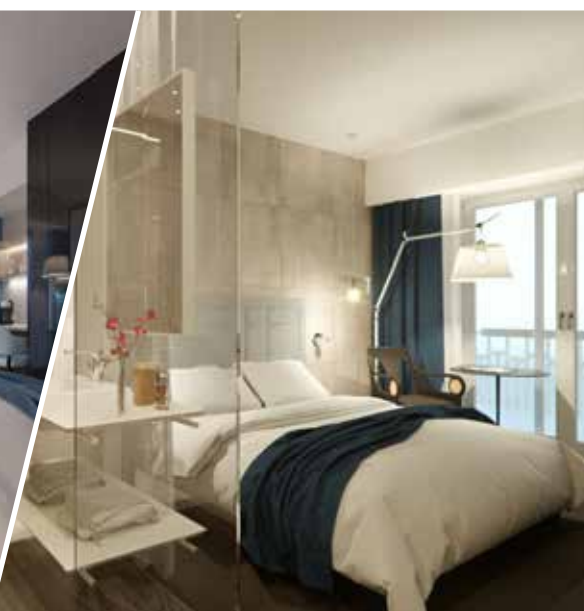
camera doppia vista mare

Attività incluse: piscine con Mare Primordiale termale, piscine con acqua di mare riscaldata, terrazza solare, spiaggia Meduza Exclusive 5* con lettini sdraio e ombrelloni, fitness, acquagym, passeggiate ed escursioni guidate in bicicletta, camminata nordica, atti-