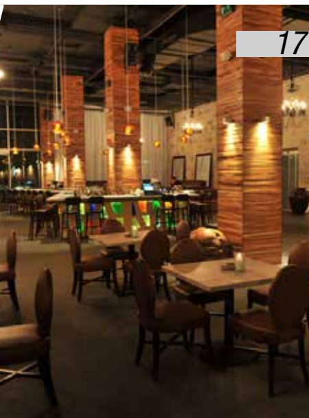
Coktail Bar Bruno