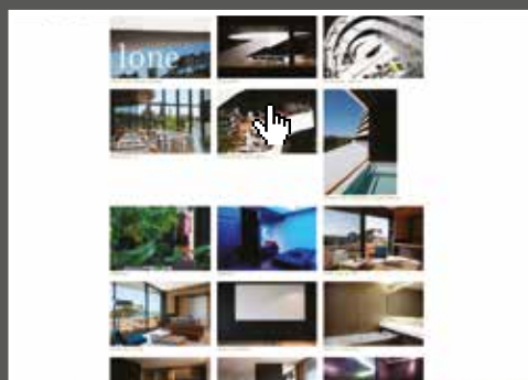
seleziona le immagini per vederle ingrandite