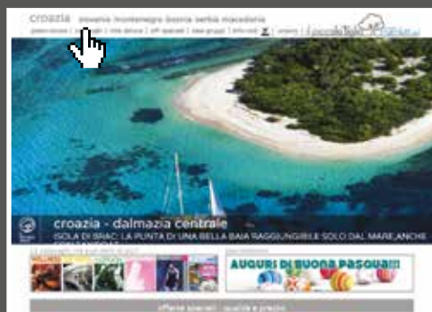
clicca sulla scritta cataloghi