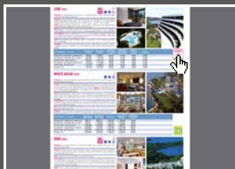
sceglie la struttura clicca il simbolo per accedere alla photogallery