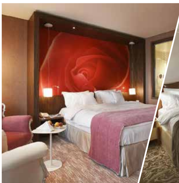
camera doppia deluxe parco