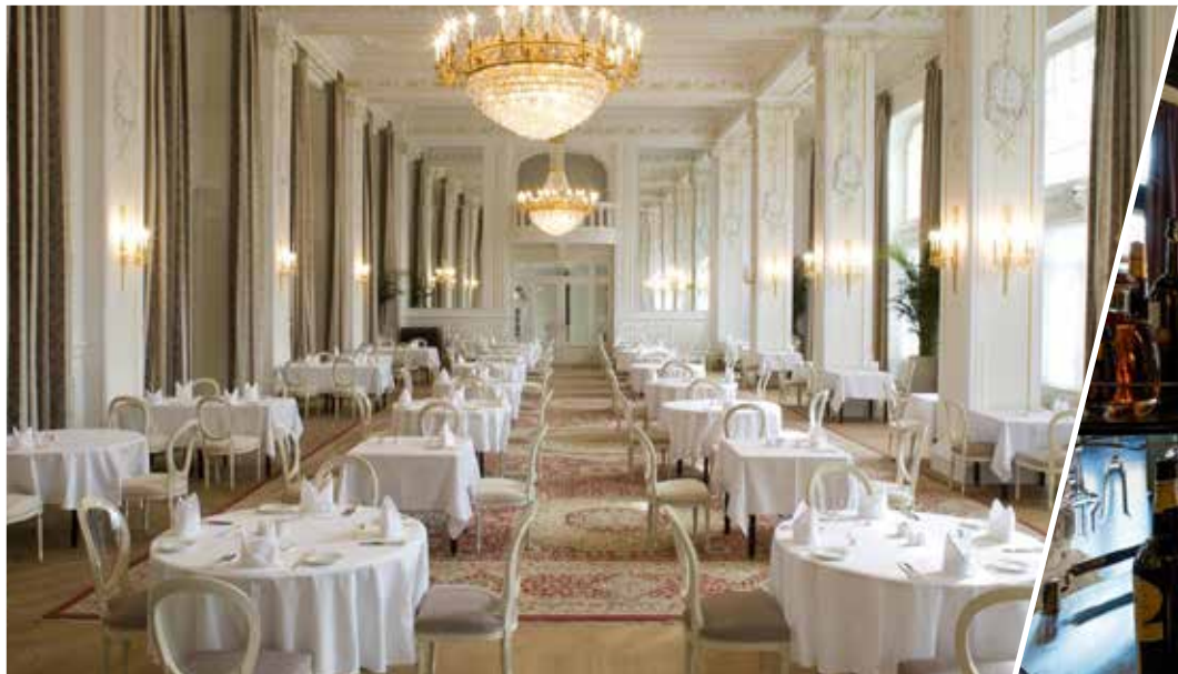
Salone dei Cristalli