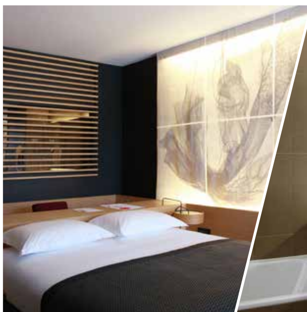
camera doppia deluxe