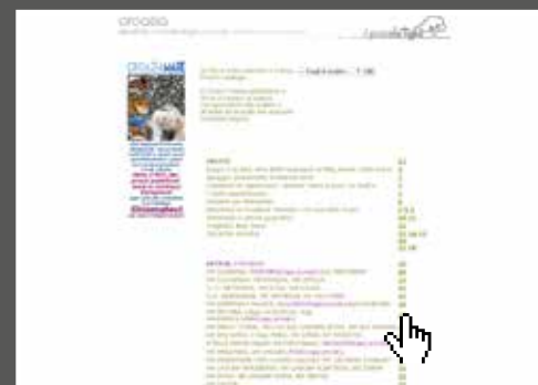
scegli una località