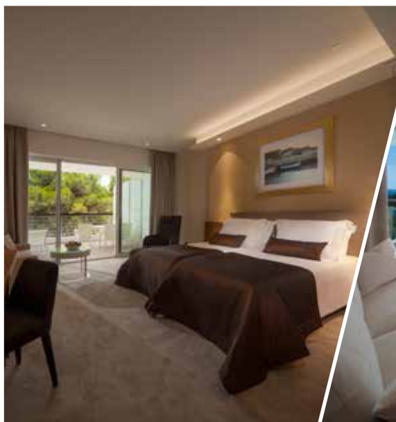
camera doppia deluxe