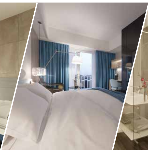
camera doppia vista mare laterale