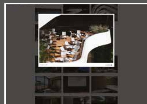
clicca la parte destra della foto per passare alla successiva, a sinistra per la precedente

“sul nostro sito non si vende, non si compra, ma ci si informa”