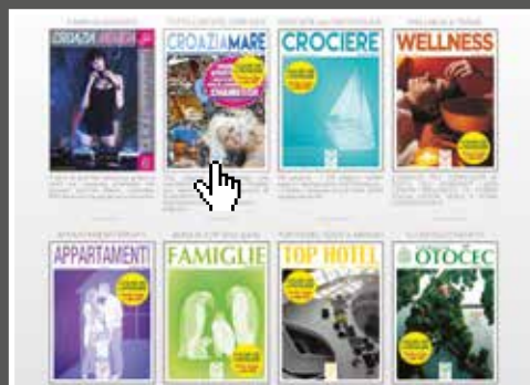
seleziona un catalogo