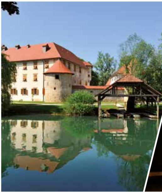
Vista dal fiume