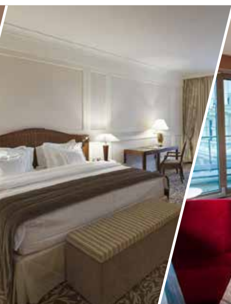
camera doppia deluxe mare