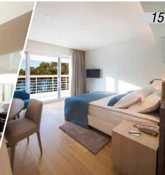
camera doppia Superior mare