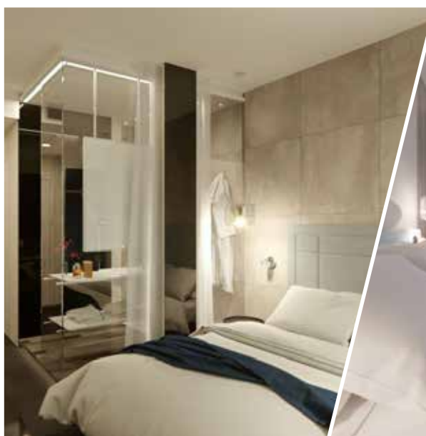
camera doppia vista mare laterale