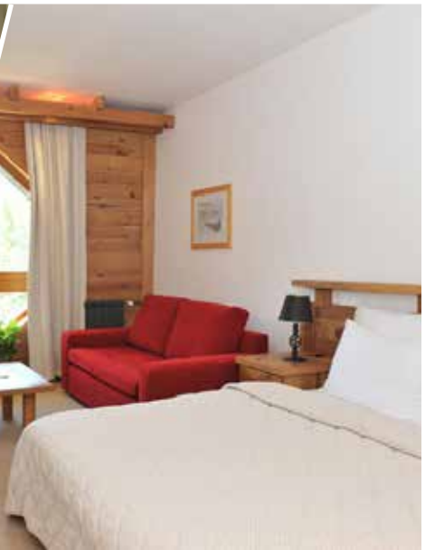
Camera doppia Executive

di della terra e attraverso le grosse finestre, offre scorci pittoreschi scorci pittoreschi sui boschi che circondano la struttura.