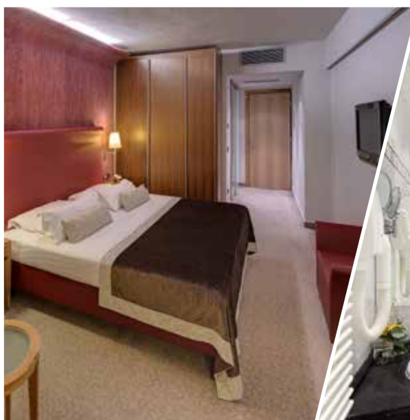
camera doppia deluxe