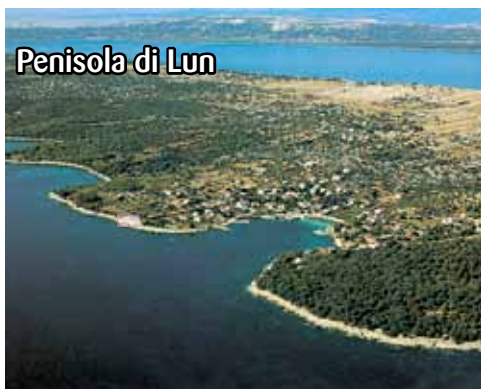
Penisola di Lun

E' sicuramente il miglior Hotel dell'Isola. Posto nel piccolo e caratteristico villaggio di Jakisnica, sulla penisola di Lun, a 20 km da Novalja e 4 da Lun. Elegante, sul mare, dispone di: camere spaziose, ben arredate e con ar.cond.; sale soggiorno e terrazze, vari bar, ristorante con pasti a buffet, piscine coperte e scoperte, piccolo wellness/fitness, tennis, parco giochi per bambini, parking.