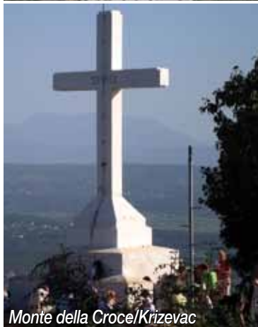
Monte della Croce/Krizevac