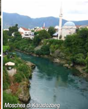
Moschea di Karadobeg