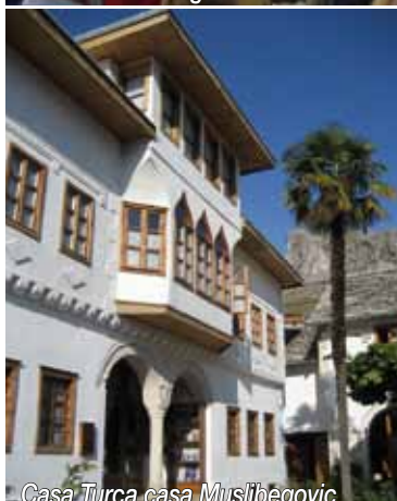
Casa Turca casa Muslibegovic