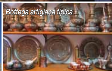
Bottega artigiana tipica