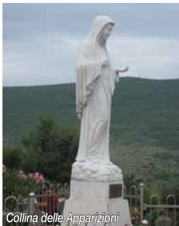
Collina delle Apparizioni