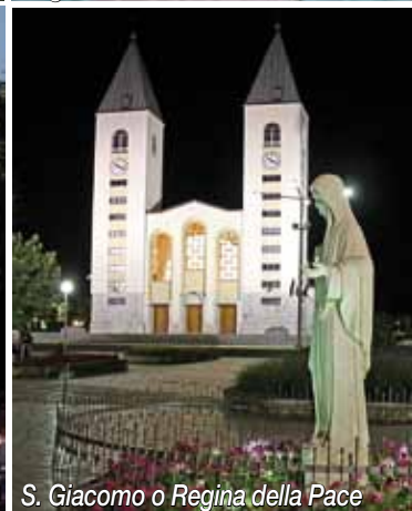
S. Giacomo o Regina della Pace