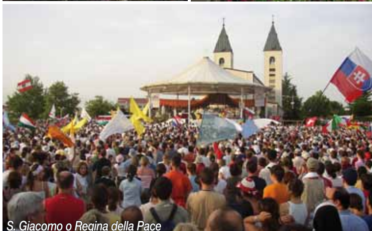
S. Giacomo o Regina della Pace