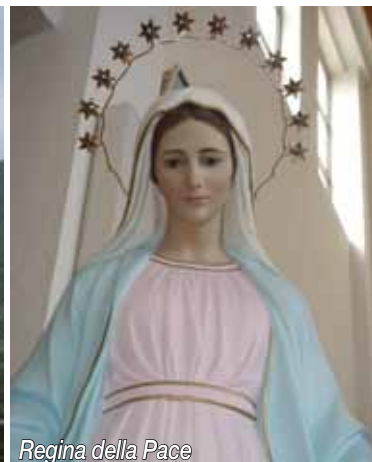
Regina della Pace