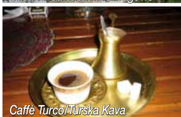
5 Caffè Turco/Turska Kava