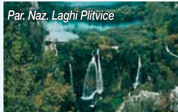
Par. Naz. Laghi Plitvice

Terminiamo con un consiglio per chi prenota una vacanza mare dal ns catalogo Croazia &amp; Slovenia: fatela precedere o seguire da una visita a Medjugorje